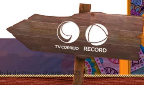
Tabela de Preços: Outubro 2023